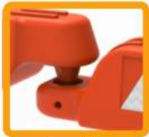
Ensamble "macho- hembra"

Con opción de acondicionarla con banderolas o torreta solar.