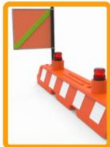
Torreta y banderola