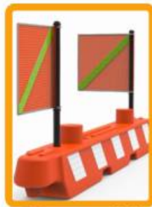
Barreno para 1 o 2 banderolas