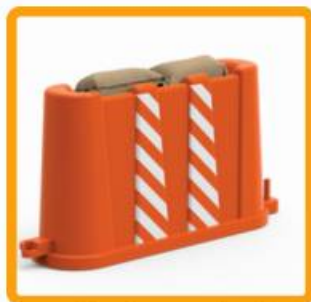
Opcional: 2 costales de arena de 5 kg cada uno