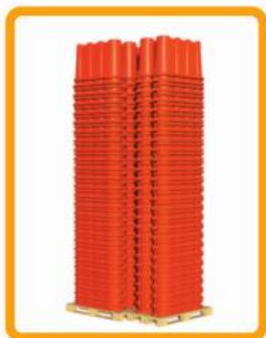
Almacenamiento de hasta 99 piezas por tarima